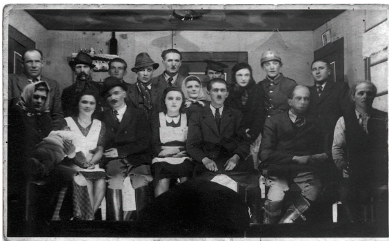
Divadelní aktivity se ujal v následujících letech už jen školní žactvo v příležitostných představeních. Např. v roce 1943 shlédli místní obyvatelé divadelní hru "Krysař" či v padesátých letech se děti představily v pohádce "Dvanáct měsíčníků".